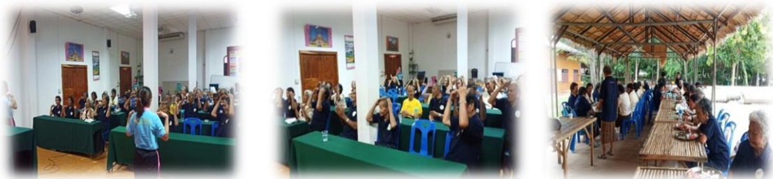
ภาพประกอบที่ 2 กิจกรรมการให้ความรู้ของโรงเรียนอาวุโสศึกษานาอ้อ

3. ผู้สูงอายุมีข้อเสนอแนะต่อการบริการโรงเรียนอาวุโสศึกษานาอ้อ อำเภอเมือง จังหวัดเลย คือ ต้องการมีความรู้เบื้องต้นเกี่ยวกับสุขภาพ ควรหาแนวทางเพิ่มรายได้ให้กับผู้สูงอายุ และให้ความรู้เพื่อส่งเสริมอาชีพเพิ่มขึ้น เพื่อให้ผู้สูงอายุสุขภาพดีขึ้น สามารถดำรงสัมพันธภาพอันดีระหว่างบุคคลในครอบครัวและเพื่อนบ้าน การพูดคุยและพบปะกับครอบครัวและเพื่อนๆ อย่างสม่ำเสมอ จะทำให้ผู้สูงอายุเกิดความรู้สึกอบอุ่นและสุขภาพจิตดี