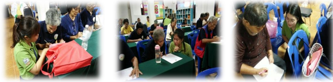
ภาพประกอบที่ 4 การเก็บรวบรวมข้อมูลวิจัยการวิจัย ณ โรงเรียนอาวุโสศึกษานาอ้อ