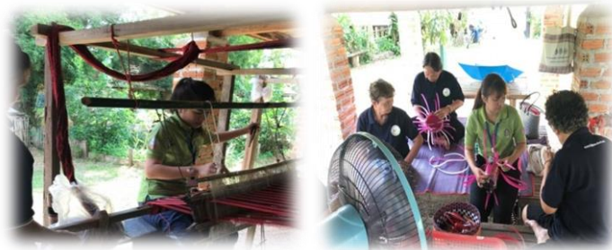
ภาพประกอบที่ 3 กิจกรรมส่งเสริมอาชีพของโรงเรียนอาวุโสศึกษานาอ้อ