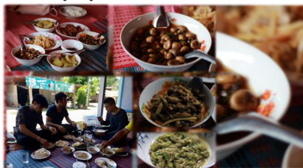
ภาพประกอบที่ 5 อาหารพื้นบ้านตามฤดูกาล (เห็ดประาะต้มเกลือ, แกงข้าวเห็ดประาะ)

2.3.2 กิจกรรมการท่องเที่ยวภายในชุมชน คนในชุมชนบ้านนาเมืองรักชาติรักถิ่น ประเพณี วัฒนธรรมและภูมิปัญญาของชุมชนได้เป็นอย่างดี มีความร่วมมือ มีแนวคิดที่ผลักดันให้ชุมชนบ้านนาเมืองเป็นแหล่งท่องเที่ยวชุมชน มีการรวมตัวกันอย่างเข้มแข็งในการพัฒนาเป็นชุมชนต้นแบบที่สามารถพึ่งพาตนเองได้ จากการสนทนากลุ่ม ผู้ให้ข้อมูลหลักเชื่อว่าชุมชนมีศักยภาพด้านการท่องเที่ยว และการพัฒนาชุมชนเป็นแหล่งท่องเที่ยวจะช่วยส่งเสริมอาชีพและช่วยเพิ่มรายได้ของคนในชุมชน ทำให้วิถีชีวิตของคนในชุมชนดีขึ้น กิจกรรมการท่องเที่ยวภายในชุมชนที่สามารถพัฒนาเพื่อรองรับนักท่องเที่ยวได้ ประกอบด้วย ปั่นจักรยานสัมผัสวัฒนธรรมชนบท ชมสะพานไม้กลางทุ่งนา ชมสาธิตการทอผ้า ฝึกงานศิลปหัตถกรรมผ้าทอมือ (บ้านนาเมือง) ร่วมกิจกรรมตามประเพณีบ้านนาเมือง ทดลองทำการเกษตร การทำนาดำ/หาปูนา/กุ้งใต้กบ และกิจกรรมประกอบอาหารถิ่น อั่วปู/ผัดเผ็ดกบ