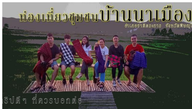
ภาพประกอบที่ 4 สะพานไม้บ้านนาเมือง (จุดชมทิวทัศน์)

ทรัพยากรการท่องเที่ยว (1) ภูมิปัญญาท้องถิ่นด้านงานศิลปหัตถกรรม ได้แก่ ผ้าทอมือ (บ้านนาเมือง) (2) ประเพณี-พิธีกรรม ได้แก่ ประเพณีบุญข้าวเปลือก/การสู่ขวัญข้าว ประเพณีบุญพระเวสสันดรหรือบุญผะเหวด ประเพณีสงกรานต์ ประกอบด้วยกิจกรรมที่สำคัญคือ การแห่ต้นดอกไม้ ขนทรายเข้าวัด ประเพณีแห่ปราสาทผึ้งหรือต้นดอกผึ้ง ประเพณีบวงสรวงปู่ทิดน้อย ประเพณีเข้าพรรษา/แห่เทียน ประเพณีบุญข้าวสาก ข้าวท้อ ประเพณีออกพรรษา/ตักบาตรเทโว ประเพณีลอยกระทง งานหัตถกรรมการทอผ้า และการจักสาน (3) อาหารวิถีชุมชนตามฤดูกาล ได้แก่ อั่วปูนา/ปูนาทรงเครื่อง ไข่ปาม แกงหน่อไม้สมุนไพรรักษาโรค ก้อยหอย กุ้งเต้น ข้าว (ไก่ กบ ปลา) ข้าวเหนียว ลาบเทา น้ำพริกกระทอน น้ำพริกแจ่วด้า จากที่มาเมนูชูโรง ได้แก่ ไข่ปาม หลามไก่ อั่วปู น้ำกระทอน (4) ภูเขา - น้ำตกในชุมชน ได้แก่ น้ำตกตาดน้อย และแหล่งท่องเที่ยวเส้นทางโดยรอบ ได้แก่ อุทยานแห่งชาติน้ำตกชาติตระการ ตำบลป่าแดง ชมทะเลหมอกนาชั้นบันได น้ำตกตาดปลากั้ง บ้านน้ำจวง และสวนพฤกษศาสตร์บ้านร่มเกล้า ในพระราชดำริ ตำบลป่าแดง