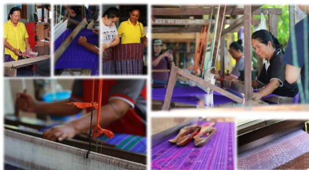
ภาพประกอบที่ 2 ศูนย์หัตถกรรมผ้าทอมือ (บ้านนาเมือง)

2.2.2 น้ำตกตาดน้อย น้ำตกตาดน้อยเป็นน้ำตกที่อยู่บริเวณใกล้กับชุมชน มุ่งหน้าไปทางหมู่บ้านน้ำภาคน้อย ประมาณ 2 – 3 กิโลเมตร ระหว่างเส้นทาง สัมผัสวิถีชีวิตชนบท บ้านเรือน ไร่ สวน เมื่อถึงที่หมายใช้เวลาเดินเท้าเข้าสู่ น้ำตก ประมาณ 1 กิโลเมตร รายล้อมด้วยไม้ธรรมชาตินานาพันธุ์