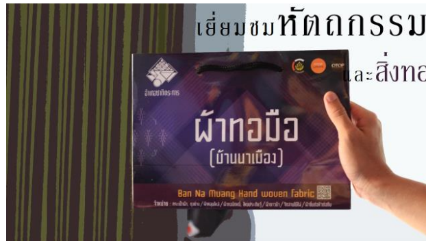
ภาพประกอบที่ 1 บรรจุภัณฑ์ผ้าทอมือ (บ้านนาเมือง)

2.2.1 กลุ่มทอผ้าบ้านนาเมือง กลุ่มทอผ้าบ้านนาเมือง ตั้งอยู่หมู่ที่ 2 ตำบลป่าแดง อำเภอชาติตระการ ก่อตั้ง เมื่อปี พ.ศ. 2535 และเริ่มดำเนินการอย่างจริงจังในปี 2542 โดยมี นางสิงห์ จันทะคุณ ได้รับเลือกให้เป็นประธานกลุ่มจนถึงปัจจุบัน และได้ใช้บริเวณบ้านของประธานกลุ่มเป็นสถานที่ให้สมาชิกมารวมกันเพื่อทอผ้า กลุ่มทอผ้าบ้านนาเมืองจึงเป็นศูนย์หัตถกรรมเพื่อการเรียนรู้ภูมิปัญญาทางวัฒนธรรมในการทอผ้าไหม ผ้าทอมือ (บ้านนาเมือง) เป็นมรดกตกทอดจากรุ่นสู่รุ่น มีลวดลายวิจิตรบรรจงที่มีการถ่ายทอดเรื่องราววัฒนธรรมชุมชนลงบนผืนผ้าไหมทอมือและยังคงคุณค่าด้วยการรังสรรค์การทอผ้าไหมแบบผืนต่อผืน ที่มีขั้นตอนมากมาย สำคัญคือเป็นอัตลักษณ์ของชุมชนแห่งนี้