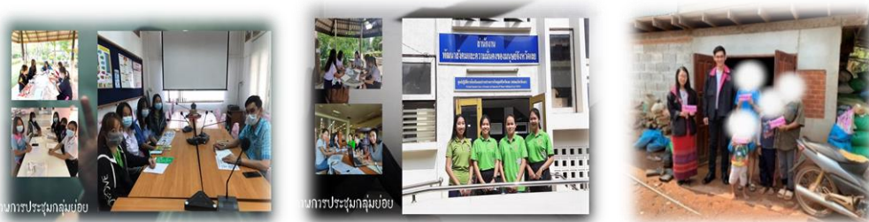
ภาพประกอบที่ 2 การประชุมเตรียมออกติดตามช่วยเหลือครอบครัวผู้ถูกรกระทำ ความรุนแรง กรณีศึกษานางไก่อ่ (นามสมมุติ) (ผู้ถูกรกระทำ)

1. สถานการณ์ความรุนแรงในครอบครัวในจังหวัดเลย ตั้งแต่ พ.ศ. 2560-2563 เกิดขึ้นทั้งหมด จำนวน 22 ครั้ง ผู้ถูกรกระทำ เสียชีวิต จำนวน 7 ราย จำแนกเป็น ผู้กระทำเพศชาย จำนวน 20 คนและเพศหญิง จำนวน 2 คน ผู้ถูกรกระทำเพศชาย จำนวน 4 คน และเพศหญิง จำนวน 18 คน ความสัมพันธ์ของผู้กระทำและผู้ถูกรกระทำด้วยความรุนแรงในครอบครัว จำแนกเป็น สามีกับภรรยา จำนวน 14 ครั้ง, บุตรกับมารดา จำนวน 3 ครั้ง, พี่กับน้อง จำนวน 2 ครั้ง, บิดาของภรรยากับบุตรชาย จำนวน 1 ครั้ง, หลานกับยาย จำนวน 1 ครั้งและญาติกับญาติ จำนวน 1 ครั้ง สถานที่เกิดเป็นบ้านตนเอง จำนวน 19 ครั้ง, บ้านญาติ จำนวน 2 ครั้งและที่สาธารณะ จำนวน 1 ครั้ง อำเภอที่เกิดความรุนแรง ประกอบด้วย อำเภอเมืองเลย จำนวน 9 ครั้ง, อำเภอปากชม จำนวน 3 ครั้ง, อำเภอเชียงคาน จำนวน 2 ครั้ง, อำเภอนาดัง จำนวน 2 ครั้ง และอำเภอวังสะพุง จำนวน 2 ครั้ง, อำเภอเอราวัณ จำนวน 1 ครั้ง อำเภอหนองหิน จำนวน 1 ครั้งและอำเภอผาขาว จำนวน 1 ครั้ง สาเหตุจากการดื่มสุราและ ยาเสพติด เป็นต้น สถานการณ์ความรุนแรงในครอบครัวใน จังหวัดเลย พ.ศ. 2563 จังหวัดเลยเกิดเหตุการณ์ความรุนแรงในครอบครัว จำนวน 8 ครั้ง ความรุนแรงในครอบครัวในอำเภอด่านซ้าย จำนวน 5 ครั้ง และอำเภอเมืองเลย จำนวน 3 ครั้ง สาเหตุส่วนมากเกิดจากการดื่มสุรา เสพยาเสพติด เป็นต้น