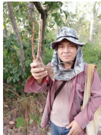
ภาพประกอบที่ 1 และ 2 หมอยาบ้านนาโสกกับสมุนไพรและทัศนียภาพหินสิ่ว