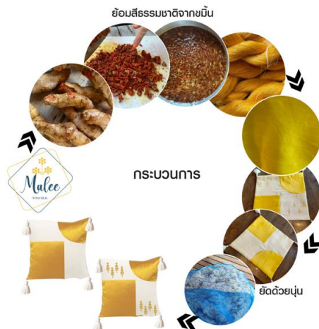
ภาพประกอบที่ 5 กระบวนการพัฒนาผลิตภัณฑ์ ผ้าไหมหมอนอิงจากผ้าไหมย้อมสีธรรมชาติ ปักลวดลายปอเทือง