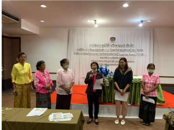
ภาพประกอบที่ 6 โครงการจัดการประชุมคําปรึกษาแนะนําเชิงลึก ภายใต้โครงการพัฒนาผลิตภัณฑ์ OTOP โดยเครือข่ายองค์ความรู้ KBO จังหวัดขอนแก่น

2.6 การประเมินผลการออกแบบ จากการประเมินเชิงคุณภาพด้วยวิธีการสนทนากลุ่มเพื่อการวิพากษ์ผลิตภัณฑ์หมอนอิง สำหรับตกแต่งจากการประยุกต์ใช้ลวดลายที่เป็นอัตลักษณ์ท้องถิ่นของอำเภอเวียงใหญ่ จังหวัดขอนแก่น : กลุ่มทอผ้าบ้านคอนนิม แบนด์มาลี ผ้าไหมแวงใหญ่ ณ โครงการจัดการประชุมคําปรึกษาแนะนําเชิงลึก ภายใต้โครงการพัฒนาผลิตภัณฑ์ OTOP โดยเครือข่ายองค์ความรู้ KBO จังหวัดขอนแก่น ตามโครงการส่งเสริมกระบวนการเครือข่ายองค์ความรู้ (Knowledge-Based OTOP KBO ) ระหว่างวันที่ 15-16 มิถุนายน 2663 ณ โรงแรม พิมานการ์เด็น บุติคโฮเทล อำเภอเมือง จังหวัดขอนแก่น สำนักงานพัฒนาชุมชนจังหวัดขอนแก่นโดยมีผู้เชี่ยวชาญด้านการออกแบบและผู้เชี่ยวชาญด้านการตลาด เข้าร่วม 5 คน พบว่า