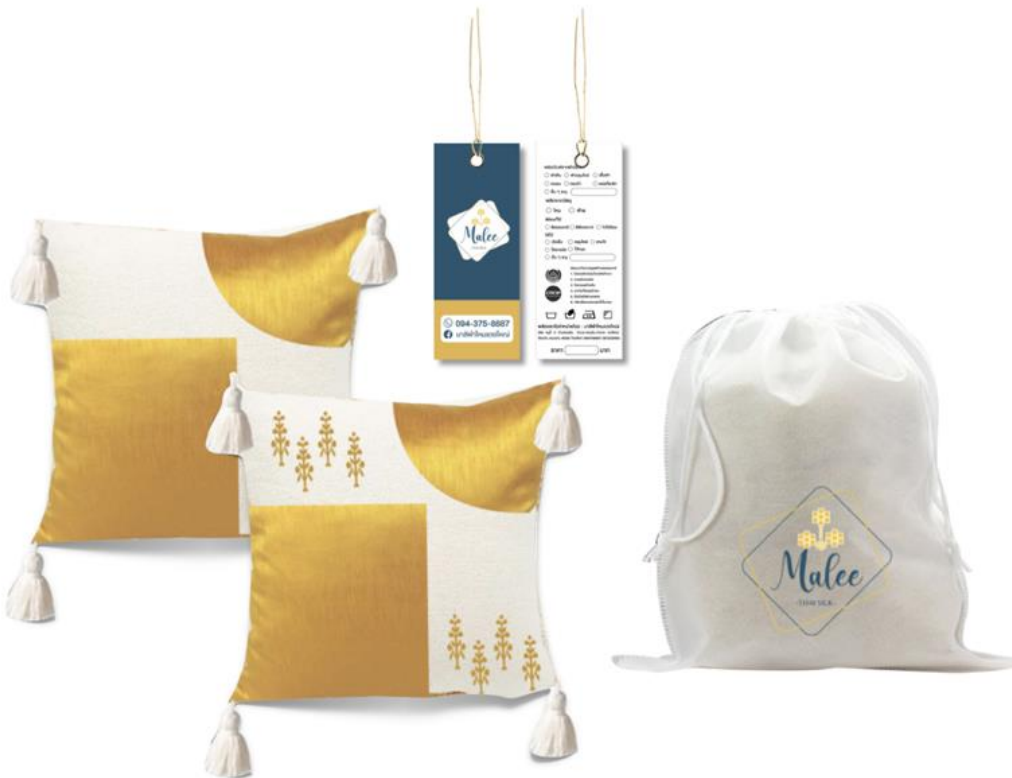
ภาพประกอบที่ 6 ภาพผลิตภัณฑ์หมอนอิงจากผ้าไหมย้อมสีธรรมชาติ (ขมิ้น) และปักลวดลายดอกปอเทืองอัตลักษณ์ของอำเภอแฉ่งใหญ่ จังหวัดขอนแก่น