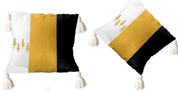
ภาพประกอบที่ 3 แบบร่างที่ 1 การจัดวางลวดลายและปักลวดลายปอเทืองบนหมอนอิง