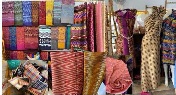
ภาพประกอบที่ 1 ผลิตภัณฑ์เดิมของ "กลุ่มทอผ้าบ้านคอนนิม (มาลีผ้าไหมแวงใหญ่)"

ผลิตภัณฑ์เดิมของกลุ่มทอผ้าบ้านคอนนิม (มาลีผ้าไหมแวงใหญ่) ประเภทผลิตภัณฑ์เดิมที่ที่ยอดจำหน่ายสูงสุด 3 ผลิตภัณฑ์ ได้แก่