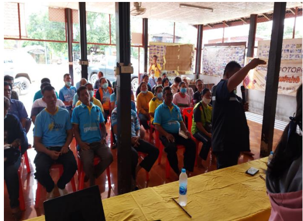
ภาพประกอบที่ 3 แสดงการใช้กระบวนการสะท้อนความรู้สึกในการวิจัยเชิงปฏิบัติการ 28 สิงหาคม 2563