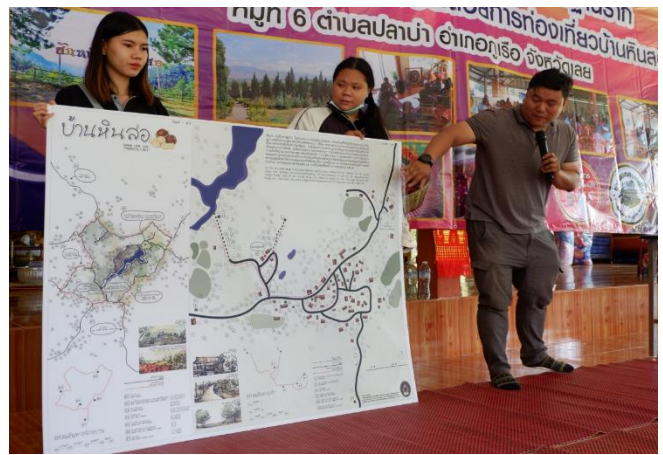
ภาพประกอบที่ 4 แสดงการใช้กระบวนการเสริมพลังในกระบวนการวิจัยเชิงปฏิบัติการ ภาพโดย วิชญ์ มะลิตัน, 10 กันยายน 2563