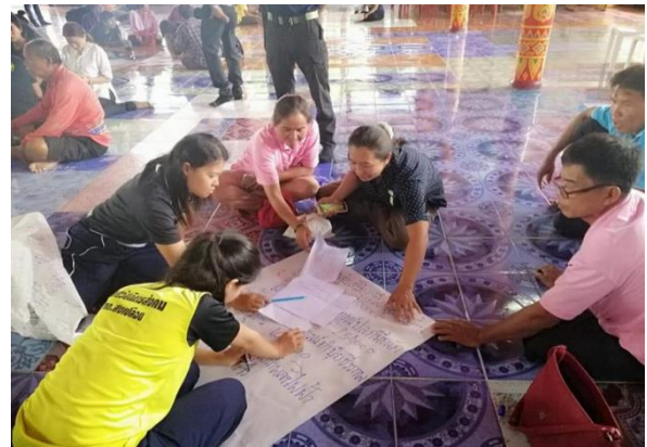
ภาพประกอบที่ 2 แสดงการใช้กระบวนการเรียนรู้ร่วมกันในการวิจัยเชิงปฏิบัติการ 20 กรกฎาคม 2563