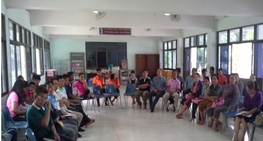
ภาพประกอบที่ 1 การประชุมภาคีกลไกชุมชนตำบลหนองกุงแก้ว (10 กันยายน 2560)

3.2 แนวทางการจัดตั้งกลไกชุมชนเพื่อพัฒนาเด็กและเยาวชนหนองกุงแก้ว จากแลกเปลี่ยนทิศทางการทำงานและร่วมกันจัดตั้งกลไกอย่างเป็นทางการ สรุปได้ว่า เป็นการจัดตั้งกลไกที่ตั้งขึ้นจากการมีส่วนร่วมของภาคีชุมชนทุกภาคส่วน มีโครงสร้างการทำงานที่ชัดเจนโดยมีแนวคิดที่ว่า ถ้าผู้ใหญ่ในชุมชนมีเครือข่ายหรือกลไกในการช่วยเหลือ ให้คำแนะนำในการทำกิจกรรมของเยาวชนได้ จะทำให้เยาวชนมีความเชื่อมั่นในสิ่งที่ทำและทำกิจกรรมออกมาได้ดี และองค์ประกอบของกลไกชุมชนประกอบด้วย ผู้นำชุมชน กำนัน ผู้ใหญ่บ้าน สมาชิกองค์การบริหารส่วนตำบล อาสาสมัครสาธารณสุขประจำหมู่บ้าน (อสม.) ตัวแทนโรงพยาบาลส่งเสริมสุขภาพประจำตำบล ผู้ปกครอง ตัวแทนโรงเรียน วัดและตัวแทนเยาวชน โดยกำหนดให้มีการกำหนดโครงสร้างการทำงาน และมีการประชุมร่วมกันอย่างสม่ำเสมออย่างน้อยปี 4 ครั้งเพื่อวางแผนการพัฒนาเด็กและเยาวชนร่วมกัน