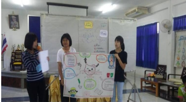
ภาพประกอบที่ 2 กิจกรรมค่ายพัฒนาเยาวชนตำบลหนองกุงแก้ว (15 พฤศจิกายน 2560)

1) ค่ายพัฒนาศักยภาพเยาวชนตำบลหนองกุงแก้ว จัดขึ้นในวันที่ 9 – 10 กรกฎาคม 2560 ณ ศูนย์ฝึกอบรมอาชีพชนบทหนองคาย ตำบลโพธิ์ชัย อำเภอเมือง จังหวัดหนองคาย โดยมีเป้าหมายเพื่อให้เยาวชนได้สนิทสนมคุ้นเคยกัน และเยาวชนสามารถเขียนโครงการพัฒนาได้ ผลที่เกิดขึ้นคือ เยาวชนสนิทสนมกันมากขึ้น ได้เครือข่ายเยาวชนระดับตำบล และเยาวชนแต่ละหมู่บ้านได้แนวทางในการเขียนโครงการเพื่อทำกิจกรรมในชุมชน ในช่วงท้ายของการเข้าค่ายได้มีการนัดหมายเยาวชนให้จัดทำร่างโครงการแล้วมานำเสนอให้ผู้ใหญ่ในตำบลให้ข้อเสนอแนะ ในกิจกรรมนี้มีผู้เข้าร่วมเป็นเยาวชนและตัวแทนที่มีวัยจ้อยจำนวน 59 คน จาก 13 หมู่บ้าน