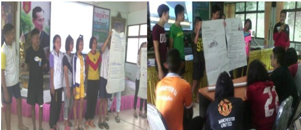
ภาพประกอบที่ 3 การนำเสนอโครงการจิตอาสาของเยาวชนกับกลไกชุมชน (30 พฤศจิกายน 2560)

2) กิจกรรมเยาวชนจิตอาสาพัฒนาชุมชน ทีมกลไกชุมชนได้ให้เยาวชนแต่ละหมู่บ้านไปคิดโครงการและนำเสนอต่อเวทีกลไกชุมชนในวันที่ 17 กรกฎาคม 2560 ณ ห้องประชุมโรงเรียนกุงแก้ววิทยาคาร โครงการเยาวชนจะเป็นกิจกรรมลักษณะจิตอาสา เน้นทำง่าย ได้ความร่วมมือและเป็นกิจกรรมที่เยาวชนอยากทำ โดยเยาวชนเป็นผู้คิดและออกแบบกิจกรรมด้วยตัวเอง หลังจากนำเสนอโครงการและรับฟังข้อเสนอแนะครบทุกหมู่บ้านแล้ว คณะทำงานกลไกชุมชนได้มอบงบประมาณสนับสนุนในการทำกิจกรรมโครงการละ 1,000 บาท