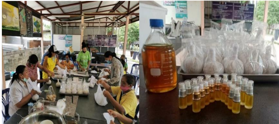
ภาพประกอบที่ 3 การอบรมเชิงปฏิบัติการเพื่อพัฒนาผลิตภัณฑ์ลูกประคบและน้ำมันไพล

ผลการทำสนทนากลุ่ม (Focus group) ประชุมระดมความคิดของสมาชิกกลุ่มแกนนำสมุนไพรบ้านโนนกราด เพื่อร่วมกันกำหนดแนวทางการจัดตั้งวิสาหกิจชุมชน รวมทั้งการพัฒนาผลิตภัณฑ์และนำแนวทางการพัฒนาสู่การปฏิบัติ โดยแนวทางการพัฒนาที่กำหนดขึ้น ได้แก่ การอบรมเชิงปฏิบัติการ เพื่อพัฒนาผลิตภัณฑ์ลูกประคบและน้ำมันไพล โดยเชิญวิทยากรเป็นแพทย์แผนไทยปฏิบัติการประจำโรงพยาบาลส่งเสริมสุขภาพตำบลนาตาขวัญ ที่มีความรู้มีประสบการณ์เป็นผู้อบรม ให้ความรู้ สาทิวิธี การพัฒนาผลิตภัณฑ์ โดยสมาชิกกลุ่มมีโอกาสได้เรียนรู้ภาคทฤษฎีและภาคปฏิบัติควบคู่กันไปทำเป็นผลิตภัณฑ์ต้นแบบ ดังภาพประกอบที่ 3