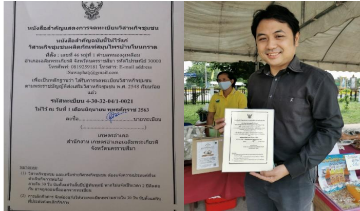
ภาพประกอบที่ 5 เอกสารการจดทะเบียนวิสาหกิจชุมชนผลิตภัณฑ์สมุนไพรบ้านโนนกรด