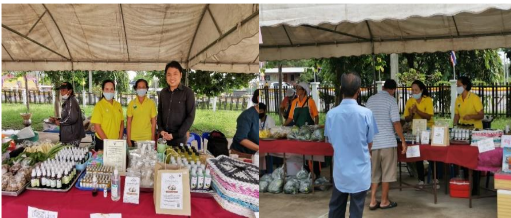
ภาพประกอบที่ 7 การนำสินค้าออกจำหน่าย ในงานธงฟ้าอำเภอนเฉลิมพระเกียรติ

ผู้วิจัยเก็บข้อมูลจากผู้บริโภคที่ซื้อผลิตภัณฑ์จำนวน 100 คน ที่ทำการพัฒนาของกลุ่มแกนนำสมุนไพรบ้านโนนกรด ตำบลหนองสูงเหนือ อำเภอนเฉลิมพระเกียรติ ดำเนินการแจกแบบประเมินความพึงพอใจ สถานที่ในการทดสอบตลาดทางกลุ่มได้รับความอนุเคราะห์จากที่ว่าการอำเภอนเฉลิมพระเกียรติ ให้นำสินค้าออกจำหน่าย ในงานธงฟ้าอำเภอนเฉลิมพระเกียรติในระหว่างวันที่ 20-21 กรกฎาคม พ.ศ. 2563 และกิจกรรมอบรมมีผู้เข้าอบรมในโครงการในวันที่ 20 สิงหาคม 2563 ณ ห้องประชุมโรงพยาบาลอำเภอนเฉลิมพระเกียรติ ดังภาพประกอบที่ 7 และภาพประกอบที่ 8