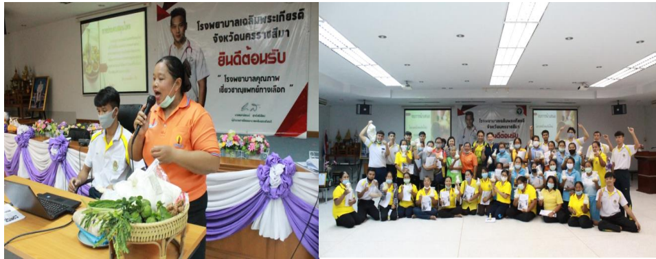
ภาพประกอบที่ 8 กิจกรรมอบรมรณรงค์เพื่อสุขภาพและการใช้ผลิตภัณฑ์ในโครงการในวันที่ 20 สิงหาคม 2563 ณ โรงพยาบาลเฉลิมพระเกียรติ อำเภอลำดวน จังหวัดสุรินทร์

ผลการประเมินความพึงพอใจที่มีต่อผลิตภัณฑ์เพื่อสุขภาพต้นแบบของกลุ่มแกนนำสมุนไพรบ้านโนนกราด ตำบลหนองสูงเหนือ อำเภอลำดวน จังหวัดสุรินทร์ จำนวน 2 ผลิตภัณฑ์ ได้แก่ ลูกประคบและน้ำมันไพล พบว่า ข้อมูลทั่วไปของผู้ตอบแบบสอบถามจำนวน 100 ชุด ส่วนใหญ่เป็นเพศหญิง จำนวน 65 คน คิดเป็นร้อยละ 65 เพศชาย จำนวน 35 คน คิดเป็นร้อยละ 35 มีอายุระหว่าง 20-30 ปี จำนวน 35 คน คิดเป็นร้อยละ 35 รองลงมาคืออายุระหว่าง 31-40 ปี จำนวน 26 คน คิดเป็นร้อยละ 26 มีอายุระหว่าง 41-50 ปี จำนวน 24 คน คิดเป็นร้อยละ 24 และมีอายุระหว่าง 51-60 ปี จำนวน 15 คน คิดเป็นร้อยละ 15 มีระดับการศึกษาส่วนใหญ่อยู่ในระดับปริญญาตรี จำนวน 50 คน คิดเป็นร้อยละ 50 รองลงมาคือระดับการศึกษาชั้นมัธยมศึกษา 38 คน คิดเป็นร้อยละ 38 ส่วนใหญ่มีอาชีพข้าราชการ/พนักงานในหน่วยงานภาครัฐ จำนวน 33 คน คิดเป็นร้อยละ 33 รองลงมาคืออาชีพเกษตรกร 26 คน คิดเป็นร้อยละ 26 รายได้เฉลี่ยต่อเดือน 10,000-20,000 บาท จำนวน 58 คน คิดเป็นร้อยละ 58 ผู้ตอบแบบสอบถามส่วนใหญ่ไม่มีปัญหาสุขภาพจำนวน 75 คน คิดเป็นร้อยละ 75 ผู้ตอบแบบสอบถามส่วนใหญ่เคยใช้ผลิตภัณฑ์สมุนไพรเพื่อสุขภาพ จำนวน 68 คน คิดเป็นร้อยละ 68 ผู้ตอบแบบสอบถามส่วนใหญ่พึงพอใจในผลิตภัณฑ์ลูกประคบมีค่าเฉลี่ยโดยรวมเท่ากับ 4.13 ส่วนเบี่ยงเบนมาตรฐานโดยรวมเท่ากับ 0.69 และผลิตภัณฑ์น้ำมันไพล มีค่าเฉลี่ยโดยรวมเท่ากับ 4.23 ส่วนเบี่ยงเบนมาตรฐานโดยรวมเท่ากับ 0.73 ซึ่งสามารถแสดงรายละเอียดความพึงพอใจ ดังตารางที่ 1