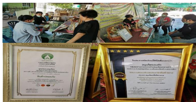
ภาพประกอบที่ 2 แสดงการสัมภาษณ์ผู้เชี่ยวชาญที่ประสบผลสำเร็จในการจำหน่ายผลิตภัณฑ์ท้องถิ่น

ผลจากการสัมภาษณ์ผู้เชี่ยวชาญที่ประสบผลสำเร็จในการจำหน่ายผลิตภัณฑ์ท้องถิ่น ผู้นำกลุ่มแม่บ้านเกษตรกรบ้านสมุนไพร หมู่ 1 ตำบลหนองสูงเหนือ อำเภอลำดวนบุรีรัมย์ ทางกลุ่มเล็งเห็นการใช้สมุนไพรในการดูแลสุขภาพเป็นภูมิปัญญาสืบทอดกันมา การนวดและประคบสมุนไพรก็เป็นหนึ่งในภูมิปัญญาที่ใช้ในการดูแลสุขภาพเบื้องต้น โดยปัจจุบันมีผลิตภัณฑ์เกี่ยวกับสมุนไพร ได้แก่ ลูกประคบ ผลิตได้มาตรฐานสินค้าปลอดภัย จากกรมการพัฒนาชุมชน กระทรวงมหาดไทย และชุดอบตัวสมุนไพร ซึ่งได้รับการคัดสรรเป็นผลิตภัณฑ์โอระดับห้าดาว และสามารถนำไปจำหน่ายในงานแสดงสินค้าระดับมาตรฐานต่างๆได้ นอกจากนี้ ในกระบวนการผลิตของทางกลุ่มยังได้ใช้อุปกรณ์ เครื่องจักรมาช่วยในการเตรียมวัตถุดิบ เพื่อควบคุมมาตรฐานการผลิตให้เที่ยงตรงมากยิ่งขึ้น ดังประกอบภาพที่ 2