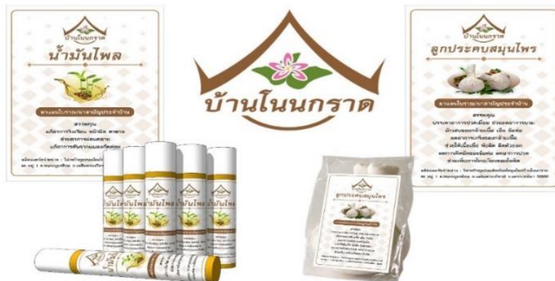
ภาพประกอบที่ 4 การออกแบบบรรจุภัณฑ์ต้นแบบ ตราสัญลักษณ์ลูกประคบและน้ำมันไพล

ผู้วิจัยได้นำข้อมูลที่ได้จากการสำรวจของกลุ่มมาพัฒนาเป็นบรรจุภัณฑ์ต้นแบบ ตราสัญลักษณ์ให้กับทางกลุ่มสมุนไพรบ้านโนนกราด โดยลักษณะดอกออกเป็นช่อแบบช่อแยกแขนง ตามชอกใบใกล้ปลายกิ่ง กลีบดอกมี 5 กลีบ โคนเชื่อมติดกัน ปลายแยกบิดเวียนรูปกังหัน สีขาวแซมสีชมพูเป็นแถบตรงกลางแต่ละกลีบ ดังภาพประกอบที่ภาพที่ 4