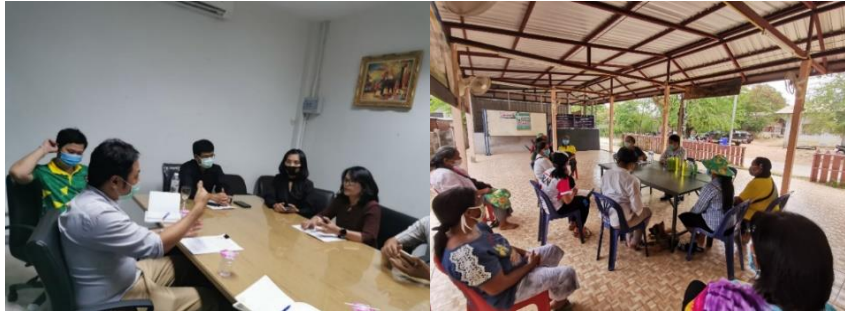
ภาพประกอบที่ 1 การสัมภาษณ์เพื่อศึกษาศักยภาพกลุ่มและผลิตภัณฑ์ของกลุ่ม

แก่การเป็นส่วนหนึ่งของเส้นทางการท่องเที่ยวของอำเภอเฉลิมพระเกียรติ อิงกระแสนักท่องเที่ยวและสุขภาพ และสนับสนุนการท่องเที่ยวเชิงสุขภาพ โดยจุดแข็งของทางกลุ่มคือเป็นกลุ่มแกนนำของชุมชนได้มีความตระหนัก และให้ความสำคัญกับการปลูกพืชสมุนไพรเป็นอาชีพเสริมและส่งเสริมให้การปลูกพืชสมุนไพรทุกครัวเรือน โดยในตอนแรกทำไว้ใช้เองและขายในราคาถูก เพื่อสร้างรายได้เสริมให้กับคนในชุมชน พืชสมุนไพรที่ปลูก เช่น ว่านหางจระเข้ มะกรูด ตะไคร้หอม อัญชัน และพล เป็นต้น ในการดำเนินงานของกลุ่มเพื่อสนับสนุนและช่วยเหลือให้สมาชิกในกลุ่มสร้างรายได้จากการเพิ่มมูลค่าให้กับวัตถุดิบในท้องถิ่น โดยรวมตัวกันเพื่อผลิตสินค้าที่ทำจากพืชสมุนไพรนำมาแปรรูปเป็นผลิตภัณฑ์เพื่อเพิ่มมูลค่าให้สูงขึ้นหลากหลายรูปแบบ เป็นการสร้างรายได้เสริมให้กับคนในชุมชน เป็นแหล่งเรียนรู้และพัฒนาสิ่งใหม่ๆ รวมทั้งเป็นการอนุรักษ์ภูมิปัญญาท้องถิ่นที่มี อีกทั้งยังได้ใช้วัตถุดิบที่มีในชุมชนให้เกิดประโยชน์สูงสุด โดยผลิตภัณฑ์แรกคือยาสมุนไพรผสมว่านหางจระเข้ อัญชัน และมะกรูด โดยผลิตออกจัดจำหน่ายให้คนในชุมชน ปัจจุบันมีการนำสมุนไพรในชุมชนมาใช้เป็นผลิตภัณฑ์ เช่น น้ำยาล้างจานมะกรูด และสเปรย์ยุงตะไคร้หอม เป็นต้น ข้อมูลดังกล่าวได้จากการสัมภาษณ์ของกลุ่มสมาชิก ดังประกอบภาพที่ 1