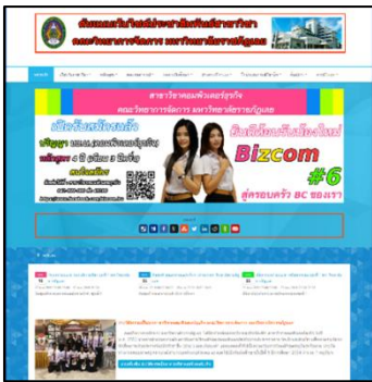
ภาพประกอบที่ 3 หน้าจอโฮมเพจ

จากภาพประกอบที่ 3 แสดงหน้าจอโฮมเพจของต้นแบบเว็บไซต์ฯ ประกอบด้วย แบนเนอร์ เมนู รวมถึงการแสดงผลที่เกี่ยวข้องกับสาขาวิชา หลักสูตร ผลงานอาจารย์ ผลงานนักศึกษา ข่าวสาร/กิจกรรม ฝึกประสบการณ์วิชาชีพ ข้อมูลศิษย์เก่า การดาวน์โหลด เป็นต้น