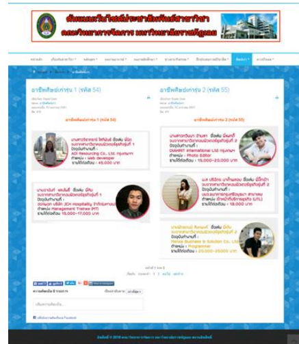
ภาพประกอบที่ 9 หน้าจอศิษย์เก่า

จากภาพประกอบที่ 9 แสดงข้อมูลที่เกี่ยวข้องกับศิษย์เก่า ได้แก่ อาชีพศิษย์เก่า และศิษย์เก่าแชรประสบการณ์