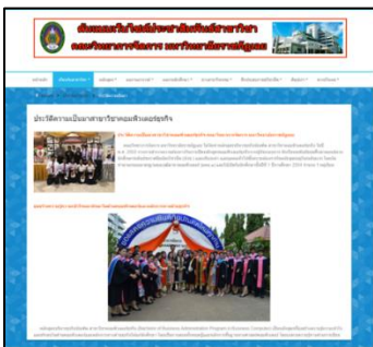
ภาพประกอบที่ 4 หน้าจอเกี่ยวกับสาขาวิชา

จากภาพประกอบที่ 4 แสดงข้อมูลที่เกี่ยวข้องกับสาขาวิชา ได้แก่ ข้อมูลหลักสูตร ปริญญาตรีภาคปกติ ปริญญาตรีภาคพิเศษ และการรับสมัคร