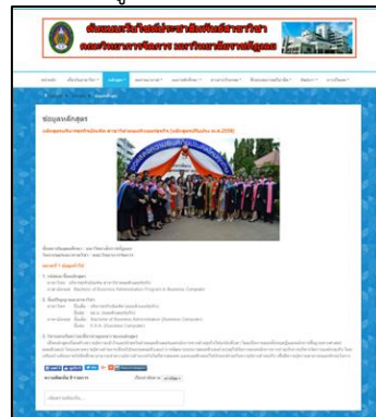
ภาพประกอบที่ 5 หน้าจอหลักสูตร

จากภาพประกอบที่ 5 แสดงข้อมูลที่เกี่ยวข้องกับหลักสูตร ได้แก่ ข้อมูลหลักสูตร ปริญญาตรีภาคปกติ ปริญญาตรีภาคพิเศษ และการรับสมัคร