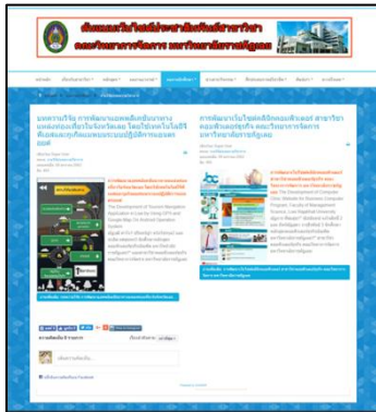
ภาพประกอบที่ 7 หน้าจอผลงานนักศึกษา

จากภาพประกอบที่ 7 แสดงข้อมูลที่เกี่ยวข้องกับผลงานนักศึกษา ได้แก่ งานวิจัย/บทความวิชาการ โครงการงานนักศึกษา งานบริการวิชาการ และรางวัล/เกียรติประวัติ