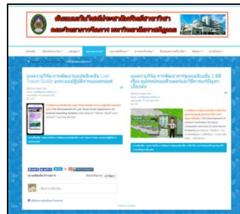
ภาพประกอบที่ 6 หน้าจอผลงานอาจารย์

จากภาพประกอบที่ 6 แสดงข้อมูลที่เกี่ยวข้องกับผลงานอาจารย์ ได้แก่ งานวิจัย/บทความวิชาการ หนังสือ/ตำรา เอกสารประกอบการสอน งานบริการวิชาการ รางวัล/เกียรติประวัติ