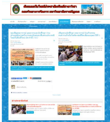
ภาพประกอบที่ 8 หน้าจอข่าวสาร/กิจกรรม

จากภาพประกอบที่ 8 แสดงข้อมูลที่เกี่ยวข้องกับข่าวสาร/กิจกรรม ได้แก่ ข่าวประชาสัมพันธ์ กิจกรรม/โครงการ ข่าวทุนการศึกษา ข่าวความรู้ ข่าวรับสมัครงาน คลังวิดีโอ และปฏิทินกิจกรรม